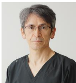
副院長/循環器内科部長 心・脳血管疾患センター長