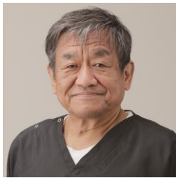
総合健診センター長 外科医

HITO病院へ4年半ぶりに戻って参りました。この4年半で学んできた知識やスキルを用いて悪性疾患だけではなく良性疾患の治療や、手術加療に加えて抗がん剤の治療や緩和ケアの面でも皆様の生活に貢献できるよう日々精進して参ります。