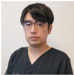
消化器外科医長 外科・肛門外科医長

2022年4月に赴任しました。外科系疾患への治療はもとより、患者さんの「いきるを支える」ために、生活に関わる様々なケアに関しても、外科総合医として積極的に取り組んでいきます。どんなことでもお気軽にご相談ください。